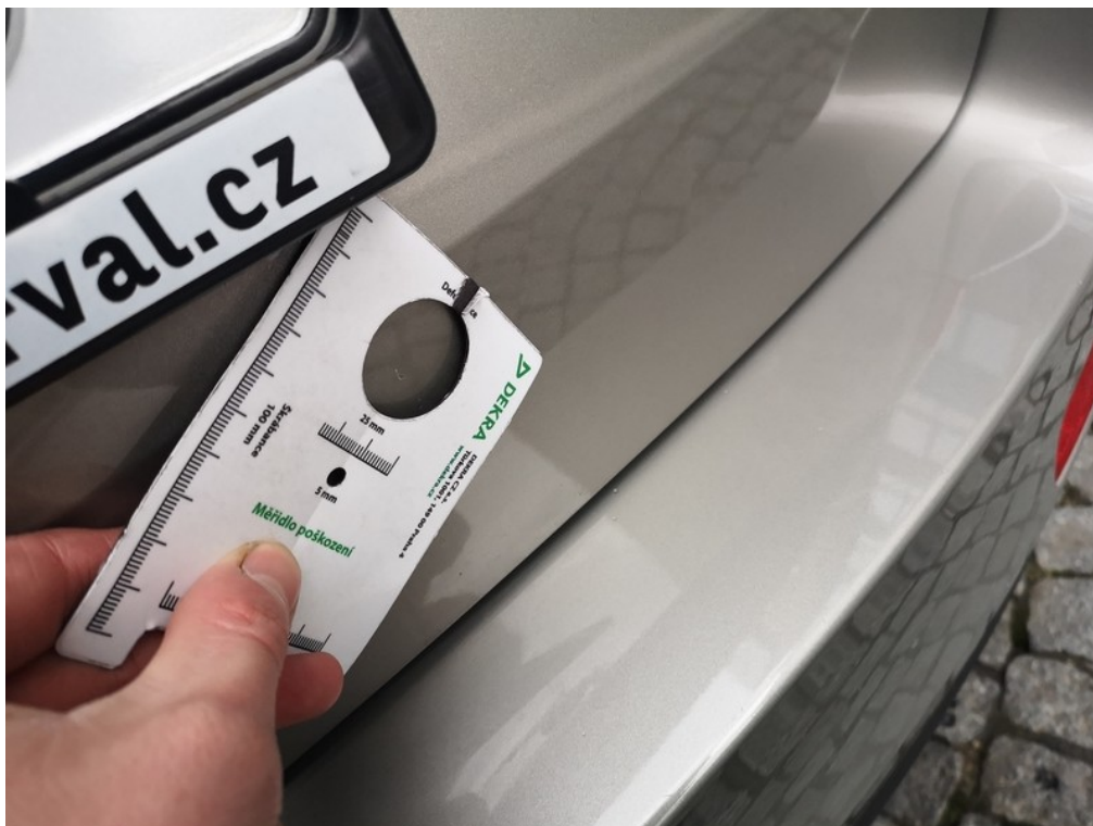
Viz popis k poškození č. 6