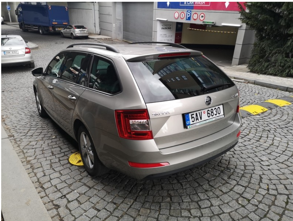
Pohled ze zadu zleva