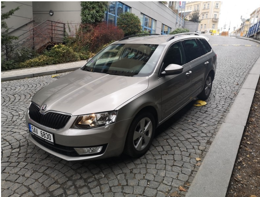
Pohled zepředu zleva