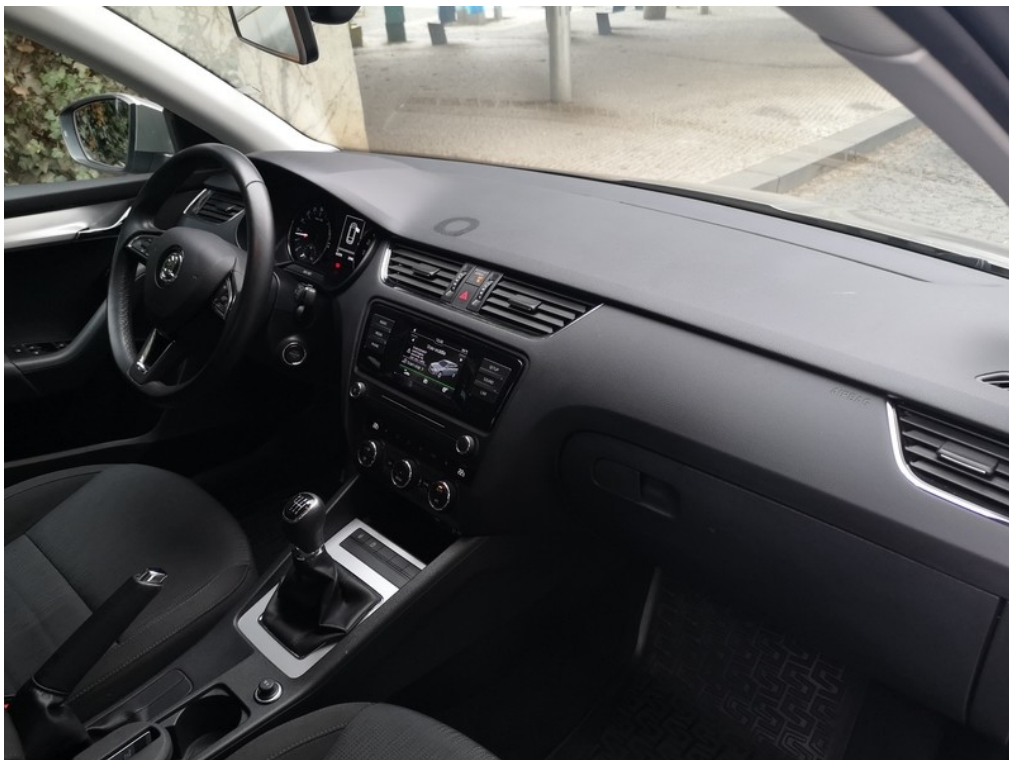
Interiér z pravé strany