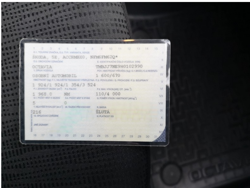
ORV č.I. str.2