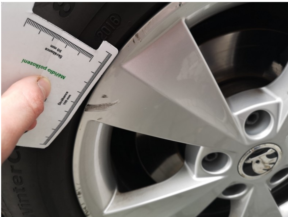
Viz popis k poškození č. 11