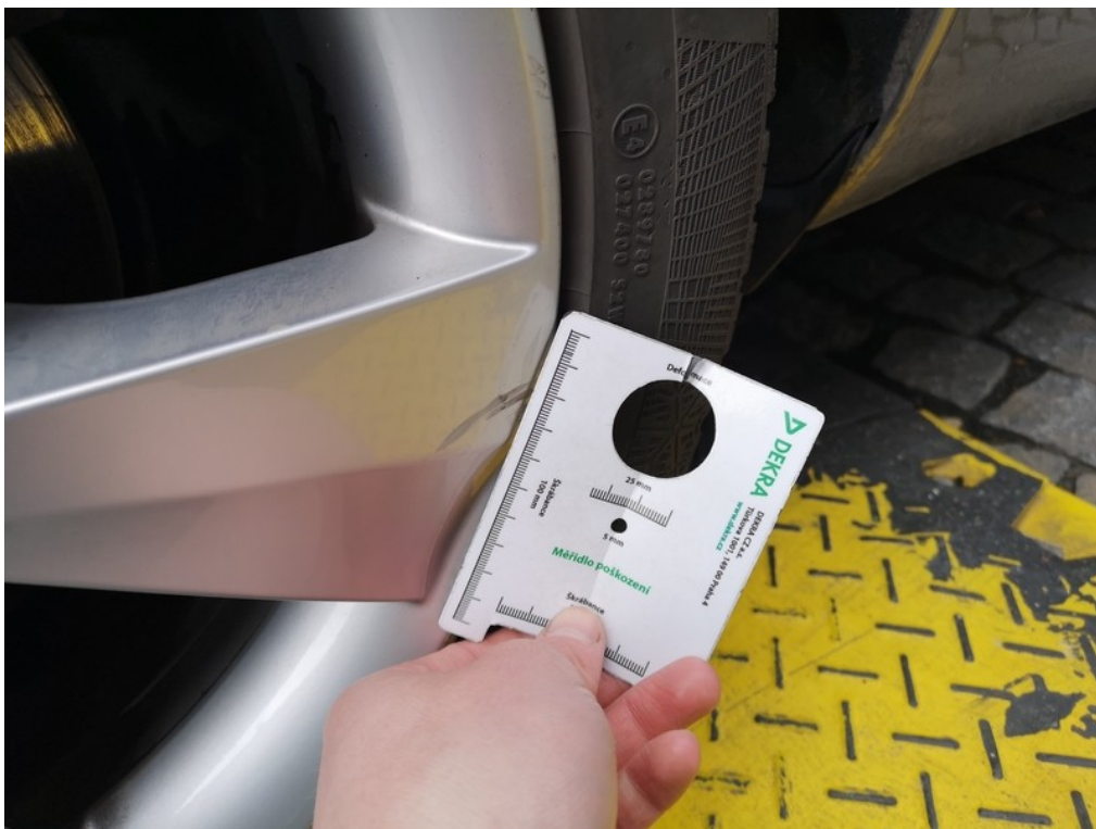
Viz popis k poškození č. 8