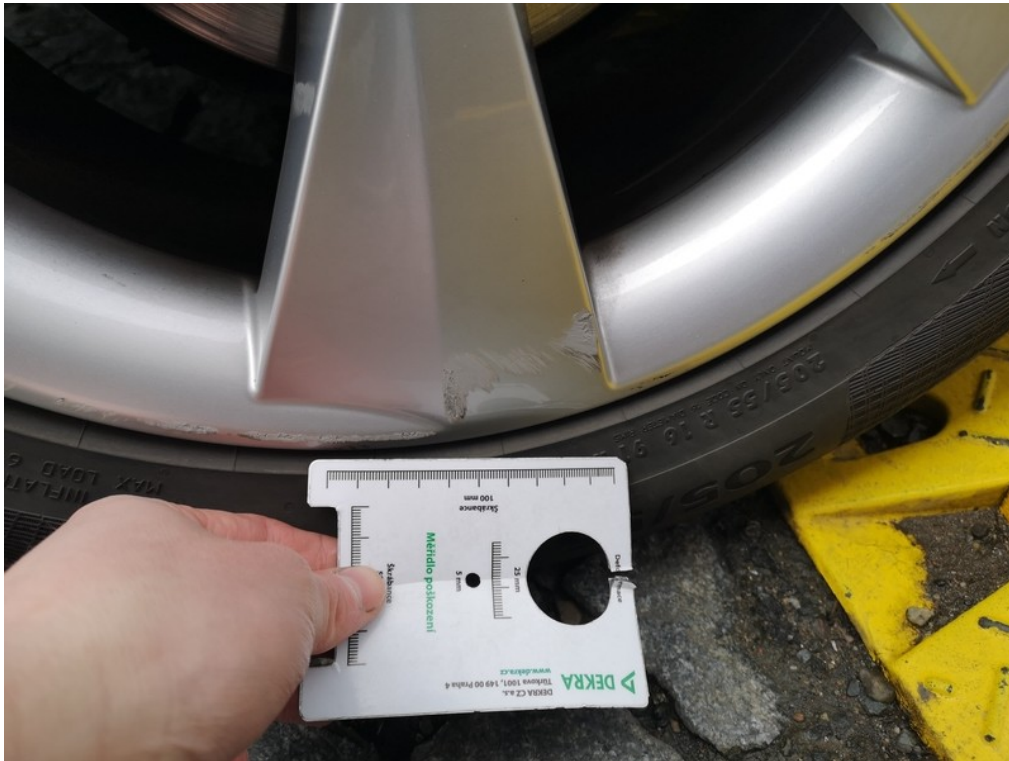
Viz popis k poškození č. 8