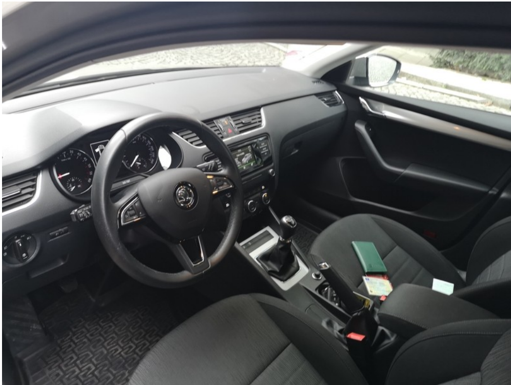
Interiér z levé strany