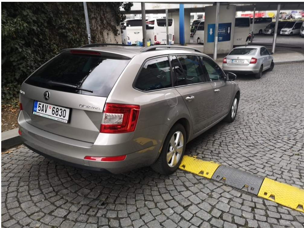
Pohled zezadu zprava