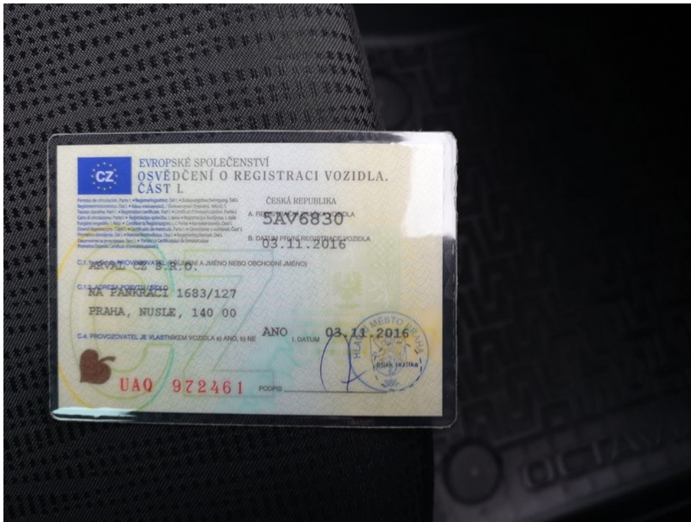
ORV č.I. str.1