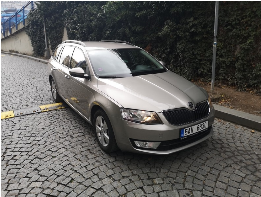
Pohled zepředu zprava