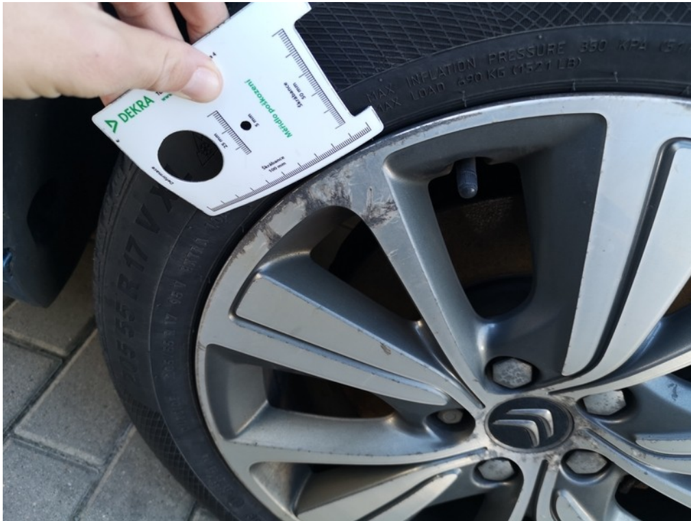
Viz popis k poškození č. 12