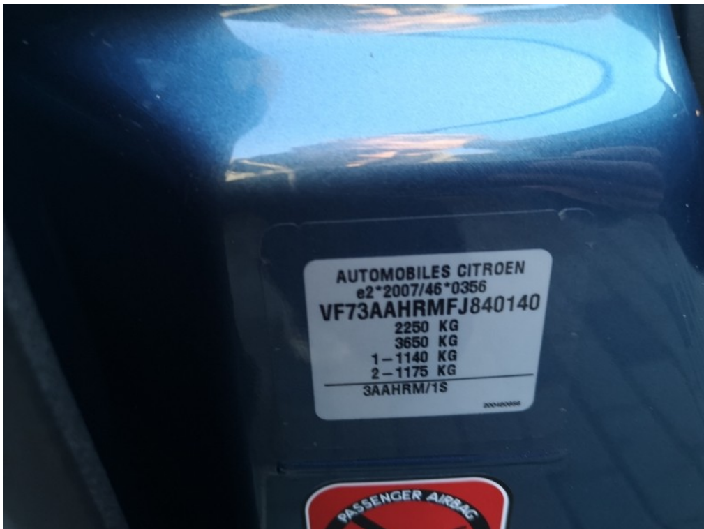
VIN / výrobní štítek