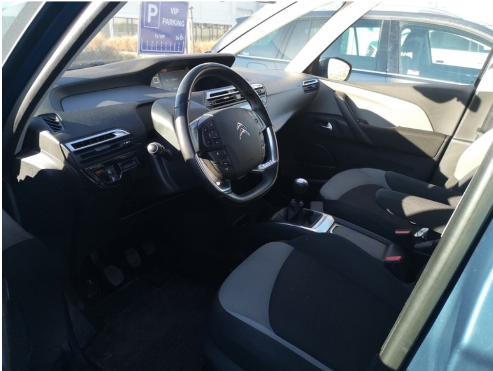
Interiér z levé strany