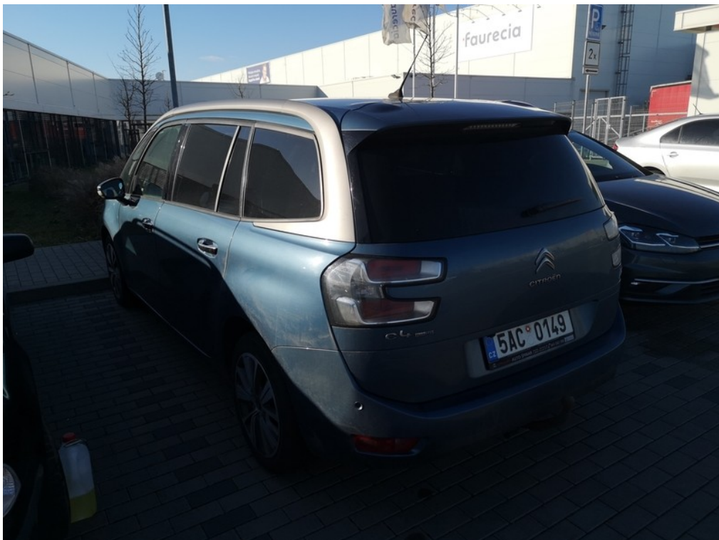
Pohled zezadu zleva