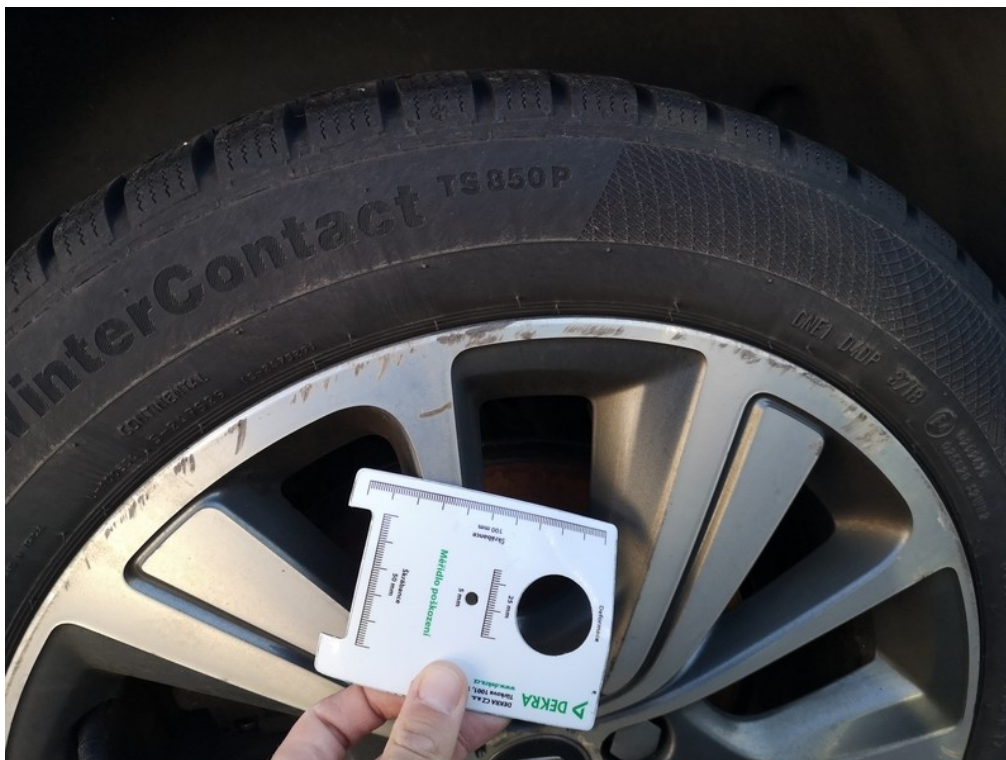
Viz popis k poškození č. 9