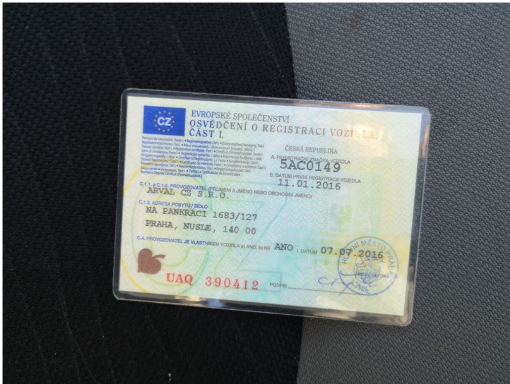
ORV č.l. str.1