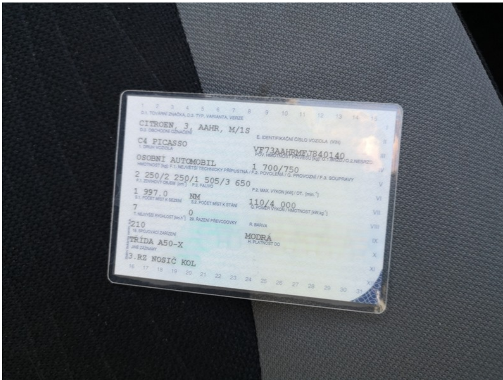
ORV č.l. str.2