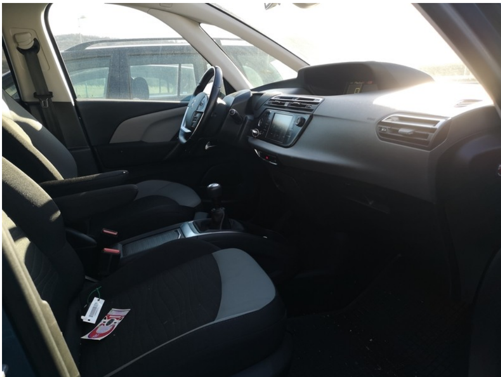
Interiér z pravé strany