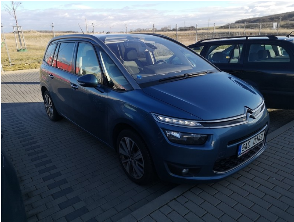
Pohled zepředu zprava