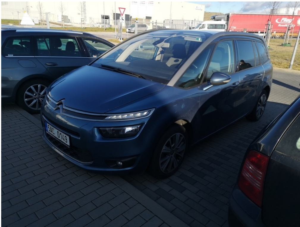
Pohled zepředu zleva