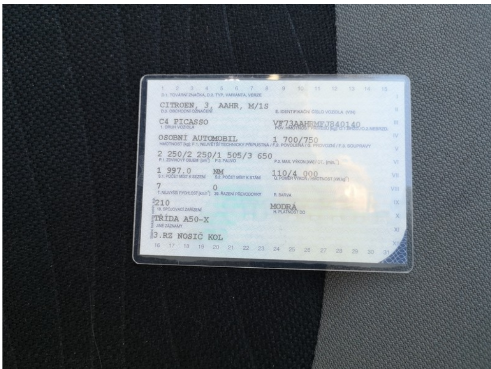
ORV č.l. str.1