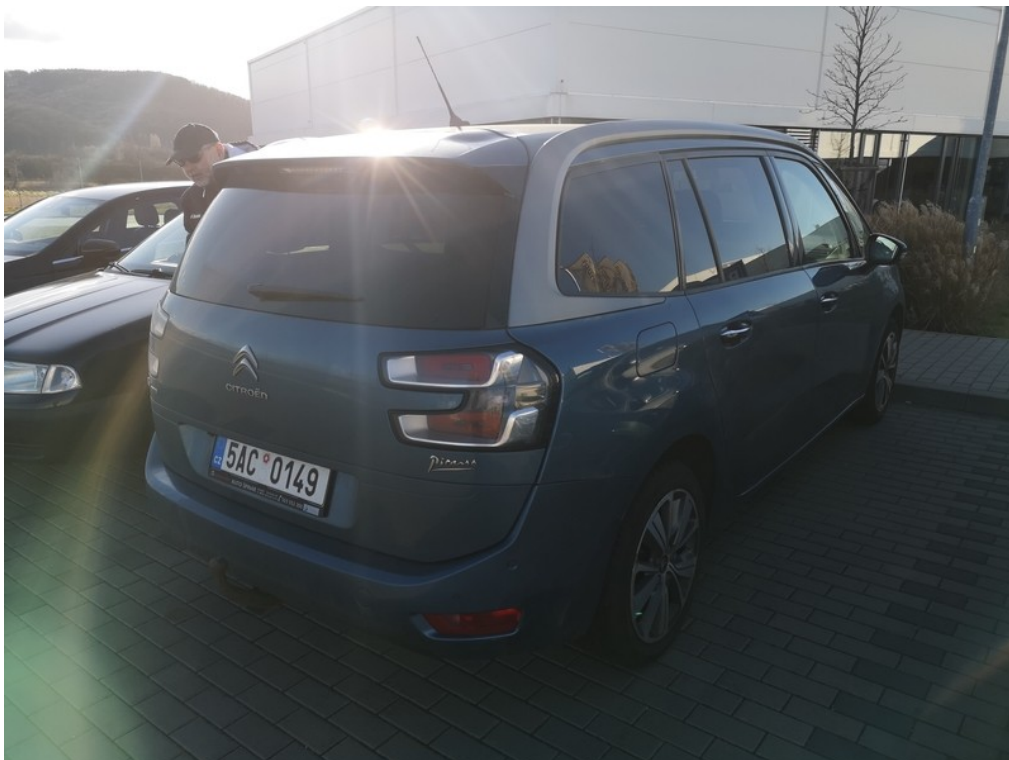
Pohled ze zadu zprava