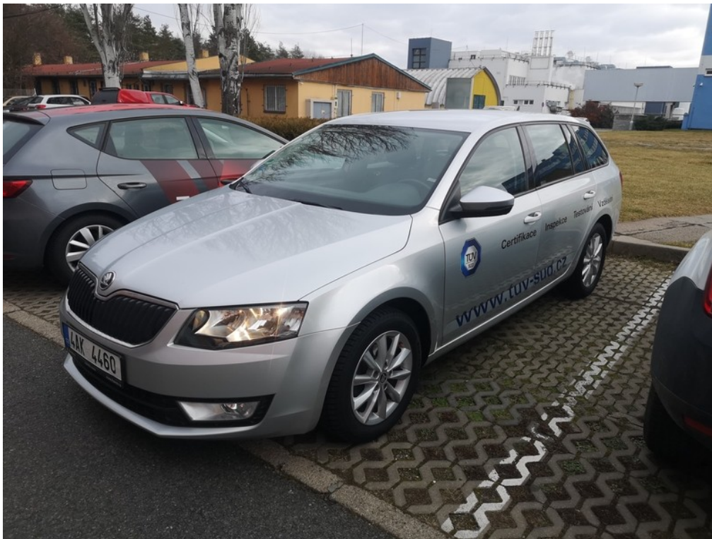
Pohled zepředu zleva