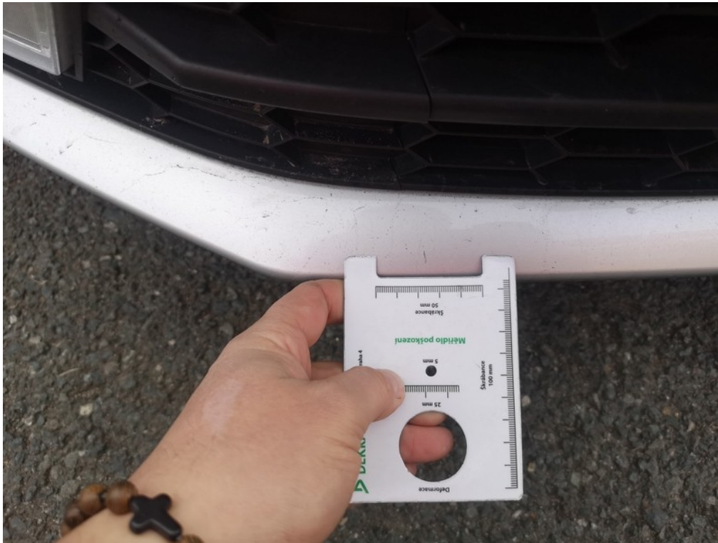
Viz popis k poškození č. 4