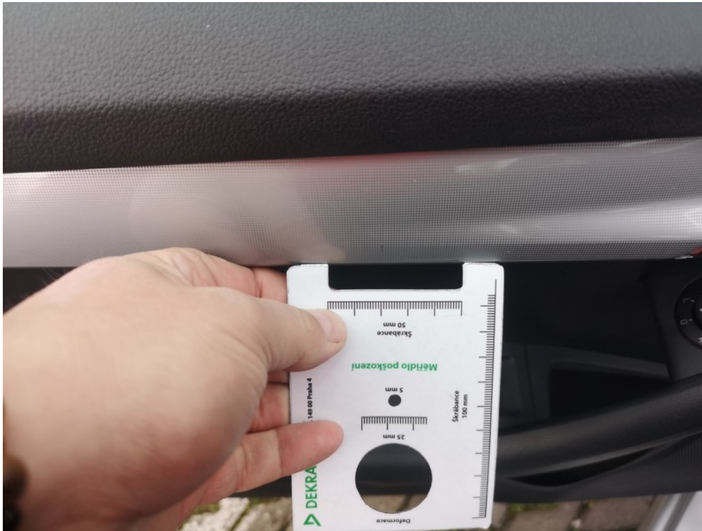
Viz popis k poškození č. 25