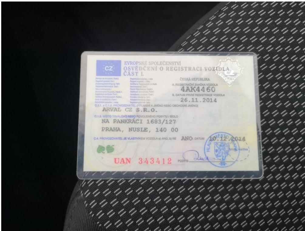
ORV č.I. str.1