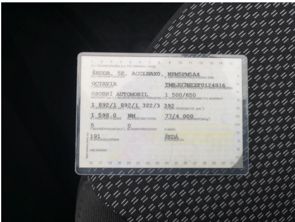
ORV č.I. str.2