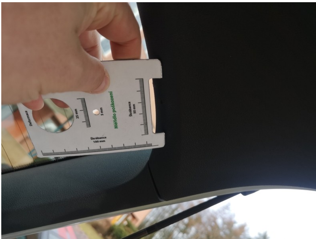
Viz popis k poškození č. 16