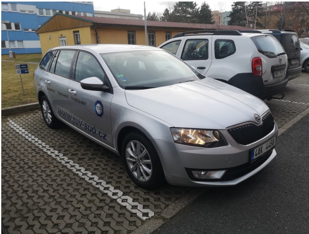
Pohled zepředu zprava