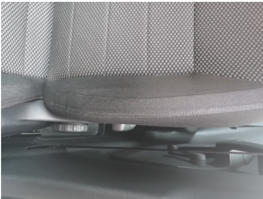
Viz popis k poškození č. 24