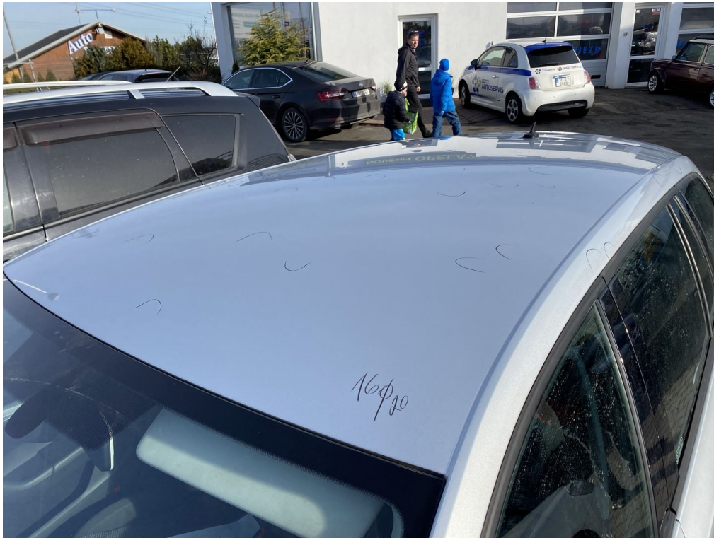
Viz popis k poškození č. 1