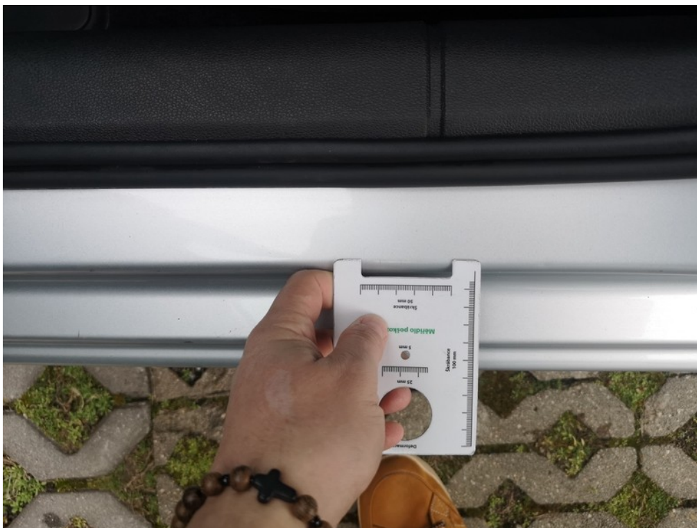
Viz popis k poškození č. 14