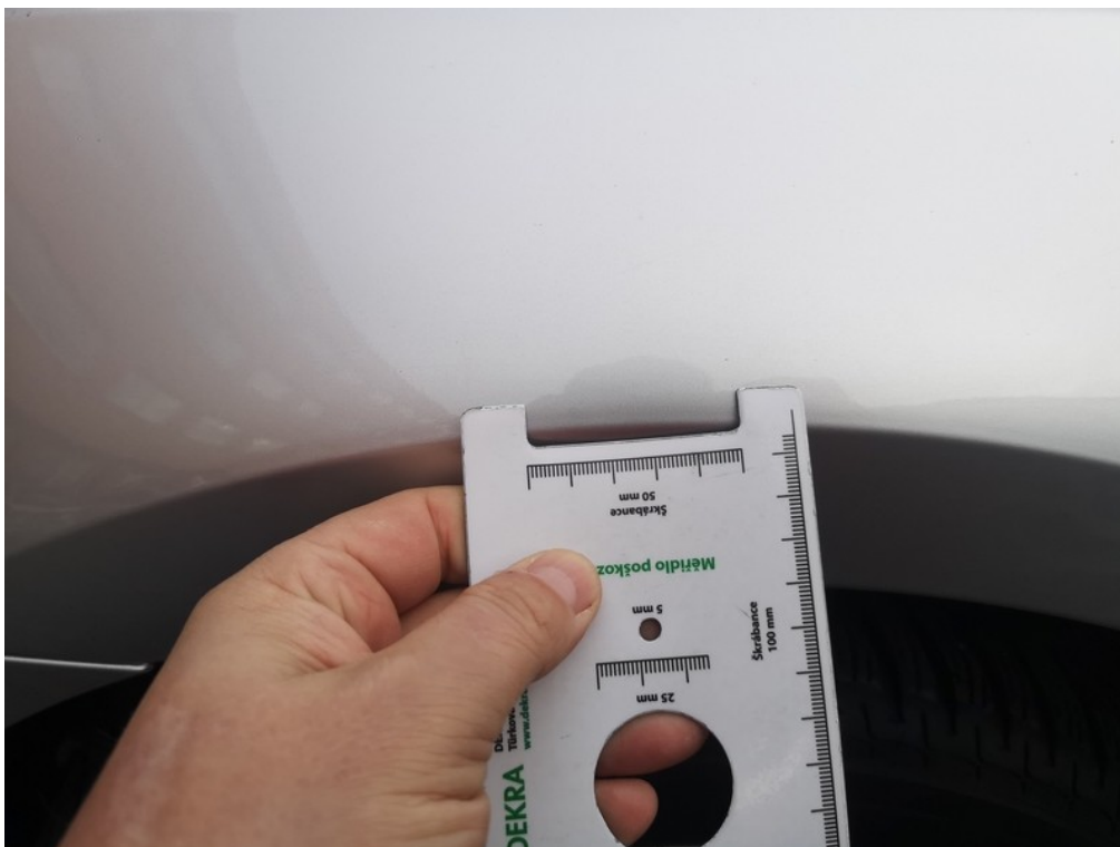
Viz popis k poškození č. 15