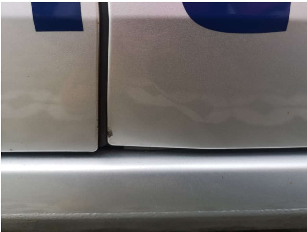
Viz popis k poškození č. 9