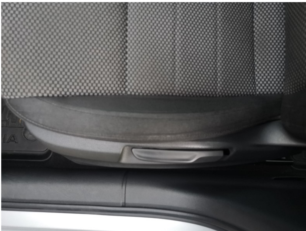
Viz popis k poškození č. 23