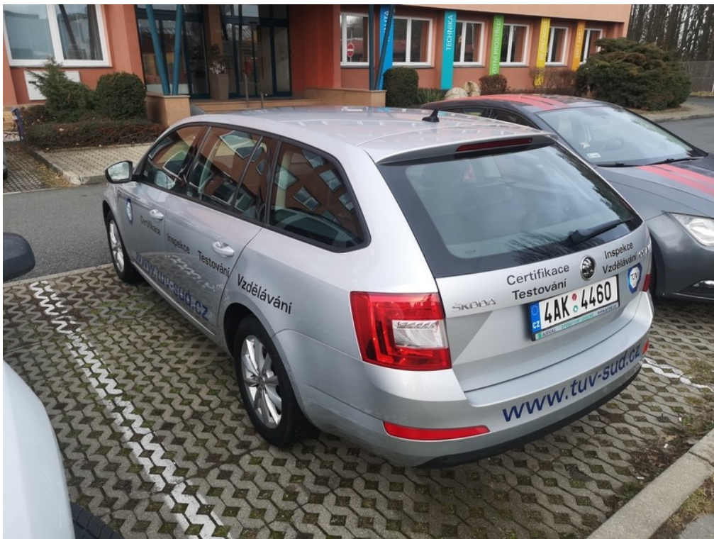
Pohled zezadu zleva