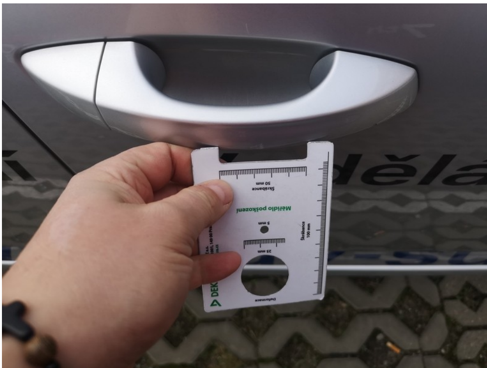
Viz popis k poškození č. 8