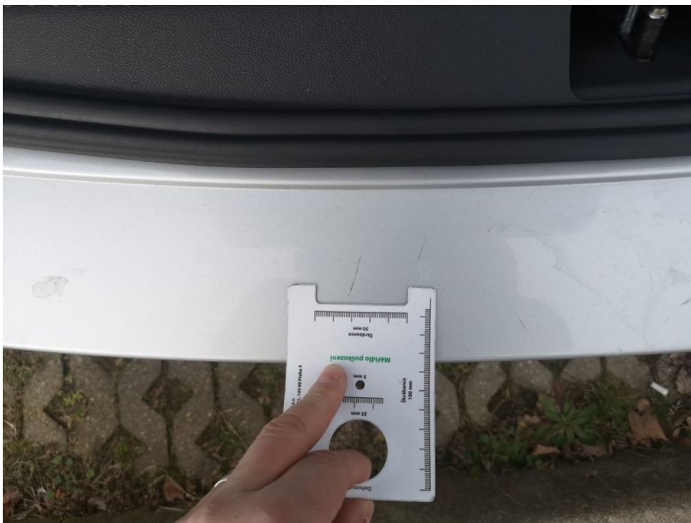
Viz popis k poškození č. 11