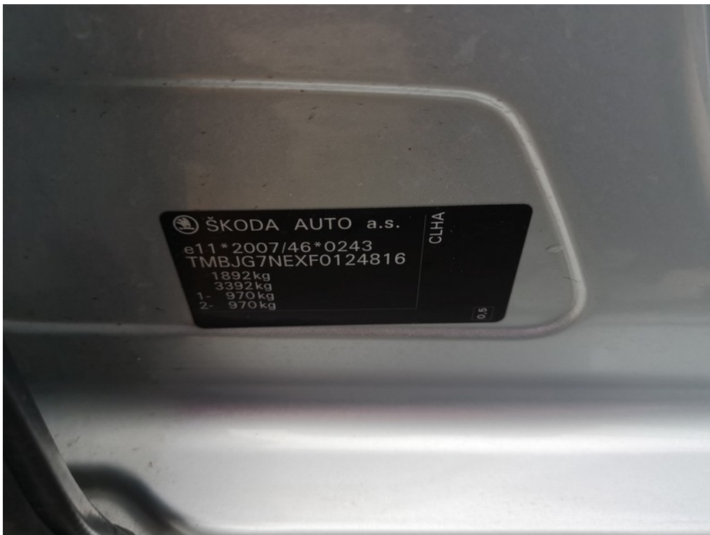
VIN / výrobní štítek