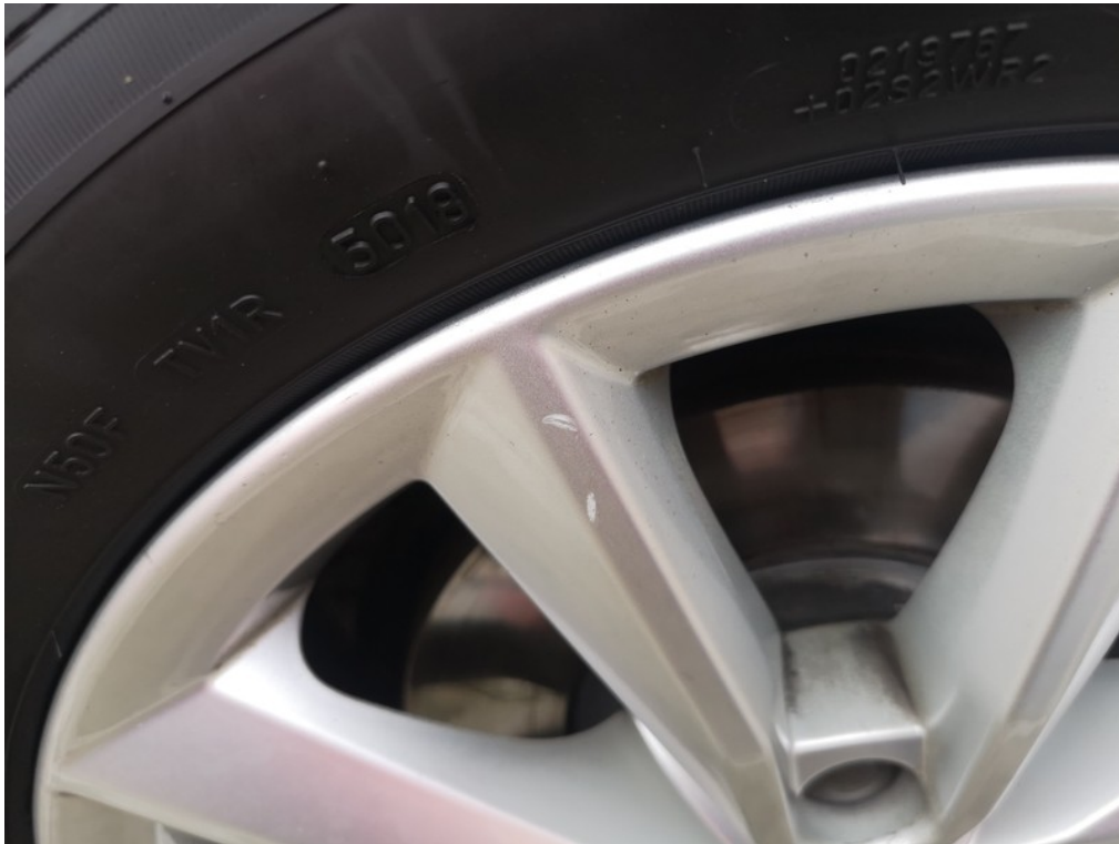
Viz popis k poškození č. 5