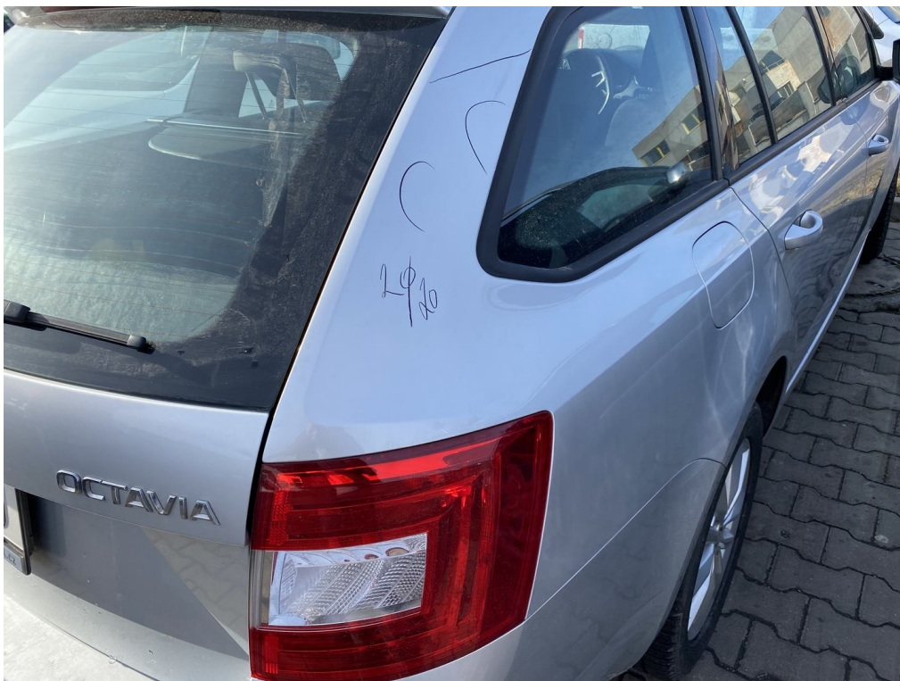
Viz popis k poškození č. 1