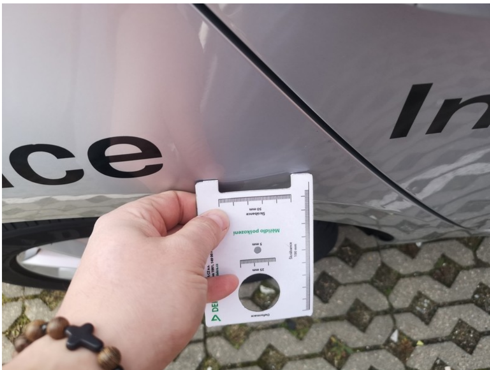
Viz popis k poškození č. 10