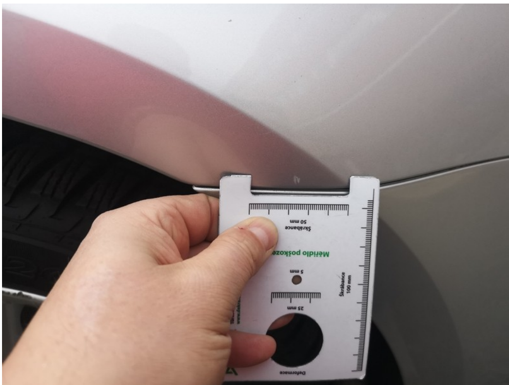
Viz popis k poškození č. 6