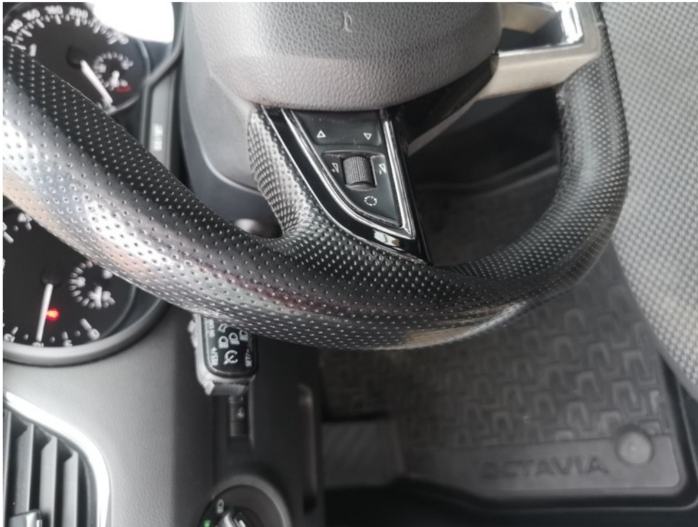
Viz popis k poškození č. 21