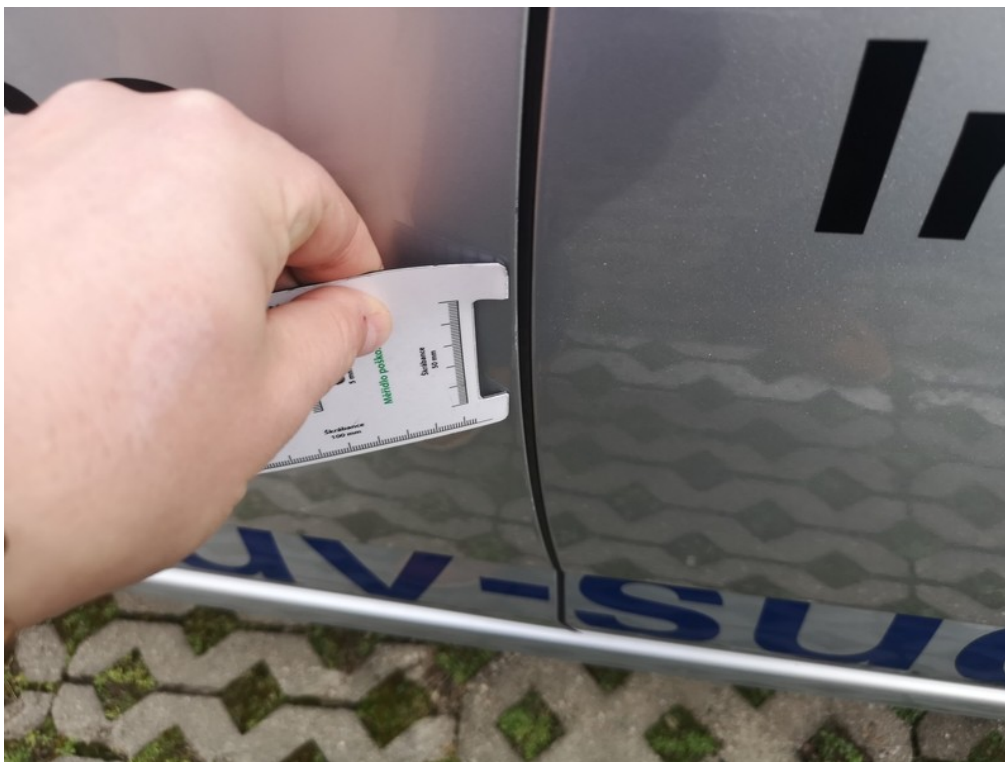
Viz popis k poškození č. 13