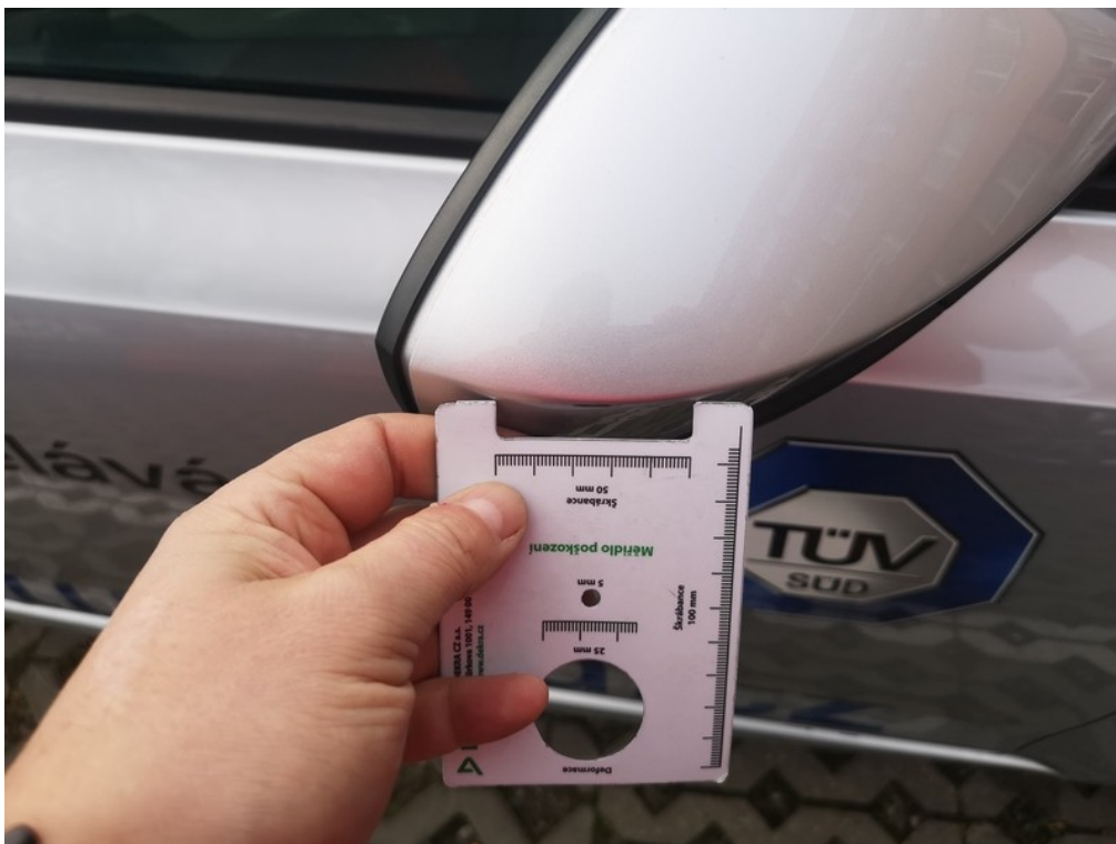
Viz popis k poškození č. 7