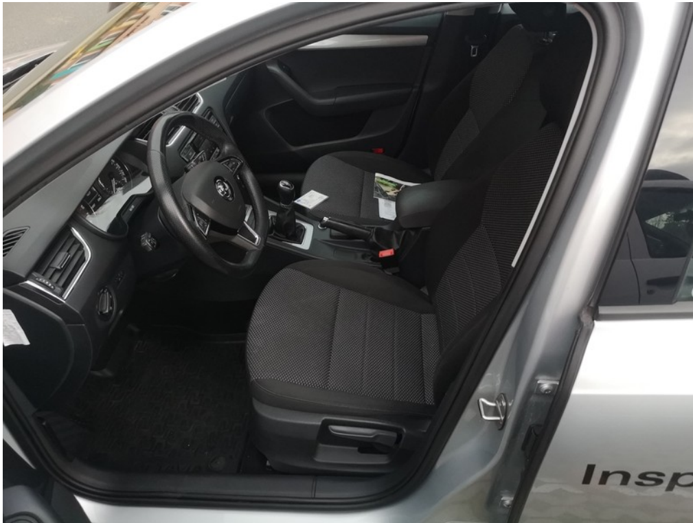
Interiér z levé strany