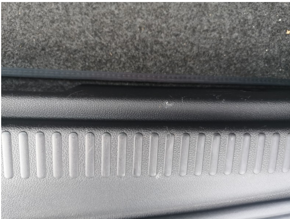
Viz popis k poškození č. 18