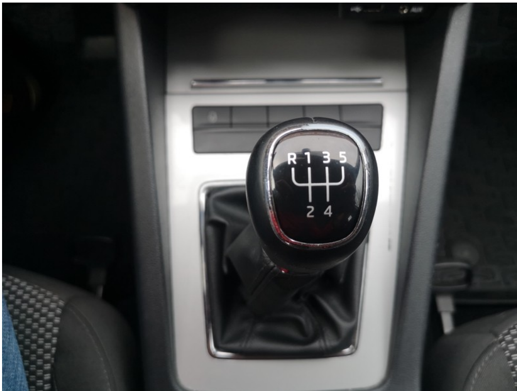
Viz popis k poškození č. 22