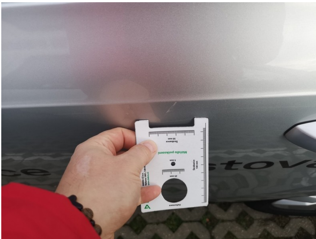
Viz popis k poškození č. 12