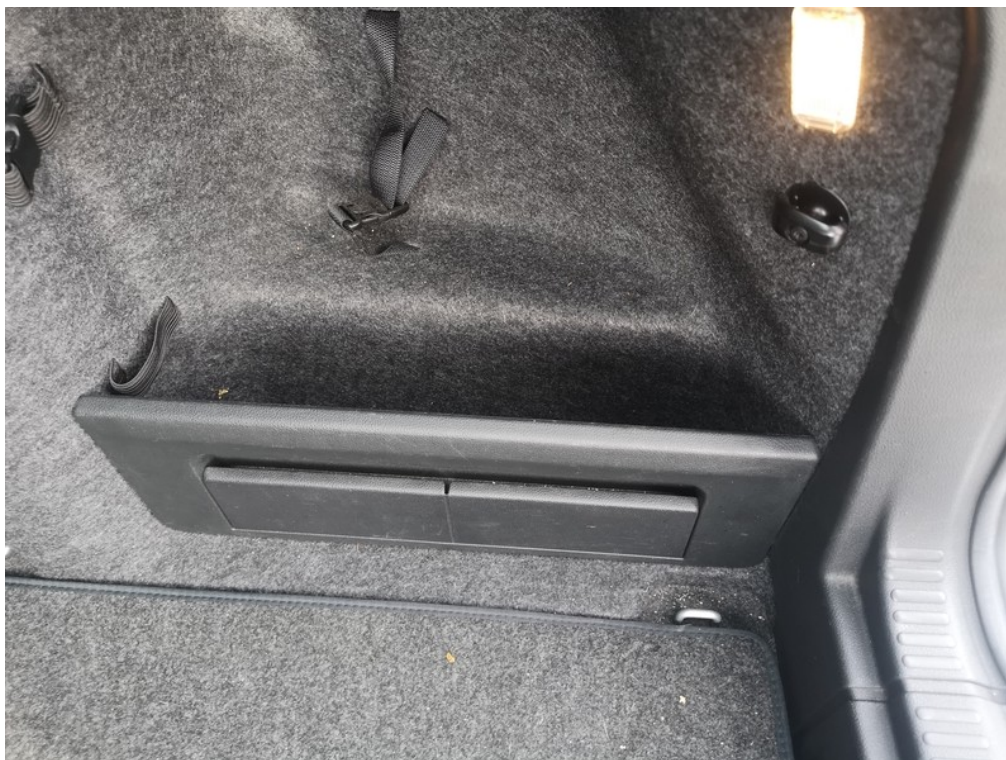
Viz popis k poškození č. 17