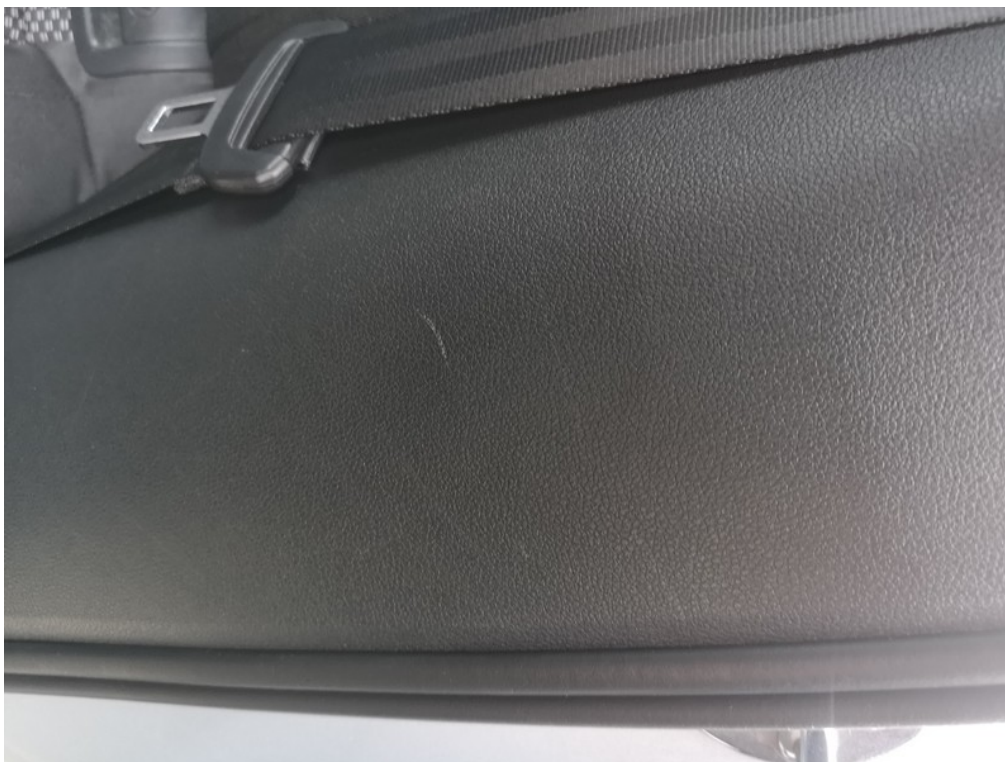
Viz popis k poškození č. 20