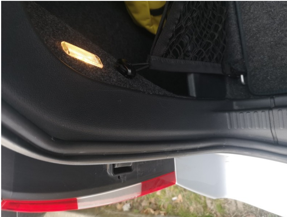
Viz popis k poškození č. 19