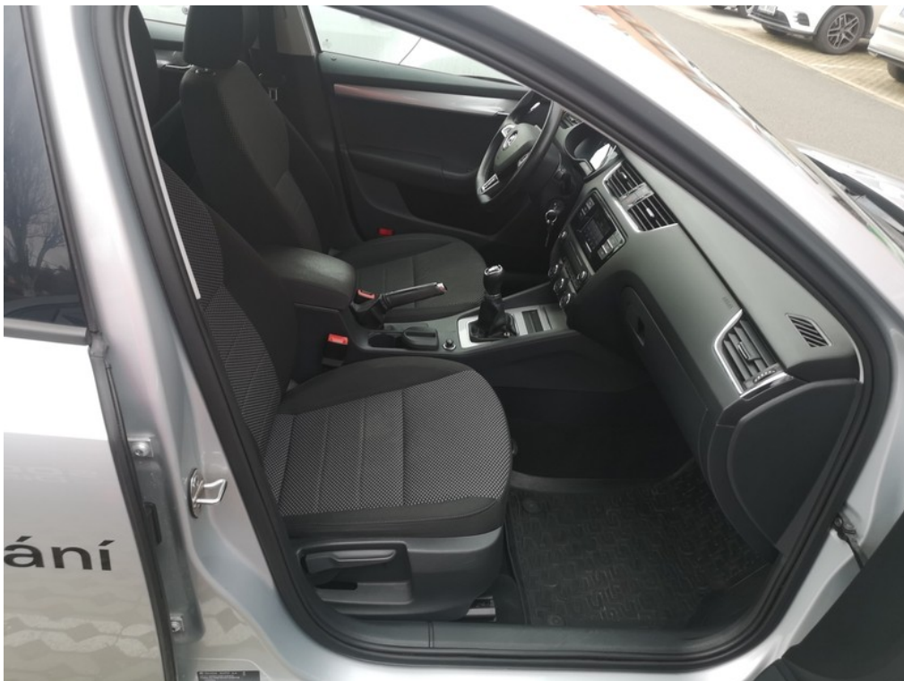
Interiér z pravé strany