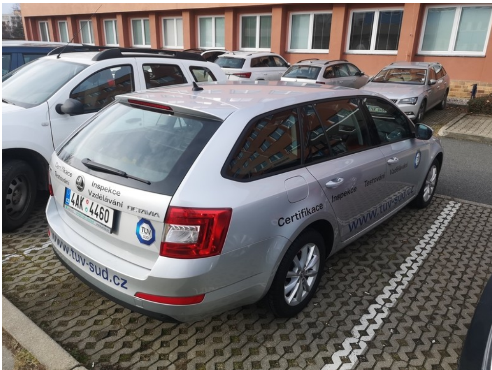
Pohled zezadu zprava